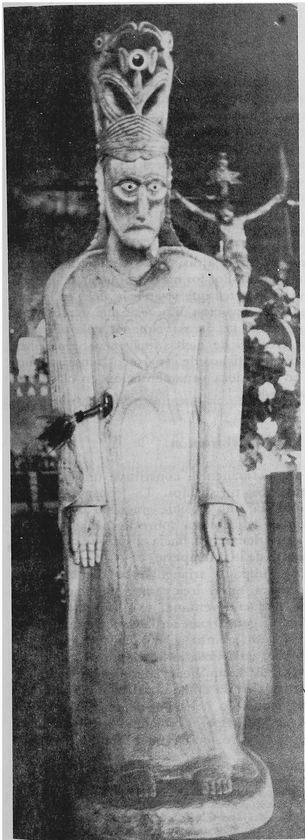
"Ko Jetu Oramay" creado por artesanos pascuenses.

Algunas de las realizaciones más significativas de esta institución han sido la creación de una imaginería religiosa autóctona en la legendaria Isla de Pascua. En 1970, con motivo de una misión que tuvo lugar allí, se talló en forma comunitaria la Virgen de Rapa Nui, plena de símbolos polinésicos, que se venera actualmente en la parroquia del lugar. En 1980, a raíz del XI Congreso Nacional Eucarístico, se esculpió, en la misma forma, el Cristo de Rapa Nui. Mide poco más de dos metros. Tiene él, además de Jesús mostrando sus llagas, a los apóstoles. De la herida del costado pende una flecha compuesta de una punta antigua de piedra obsidiana, con una varilla tallada y un penacho de plumas de gallo. Sobre su cabeza lleva una corona. En ella se ve un "manu piri" (figura tradicional pascuense con un pájaro de dos cabezas) que simboliza el Espíritu Santo. También se aprecia en el centro de ésta una cruz y un ojo que representa al Padre de los Cielos. Este ojo, así como los del Cristo, están compuesto con vértebras de tiburón y piedra obsidiana.(15)