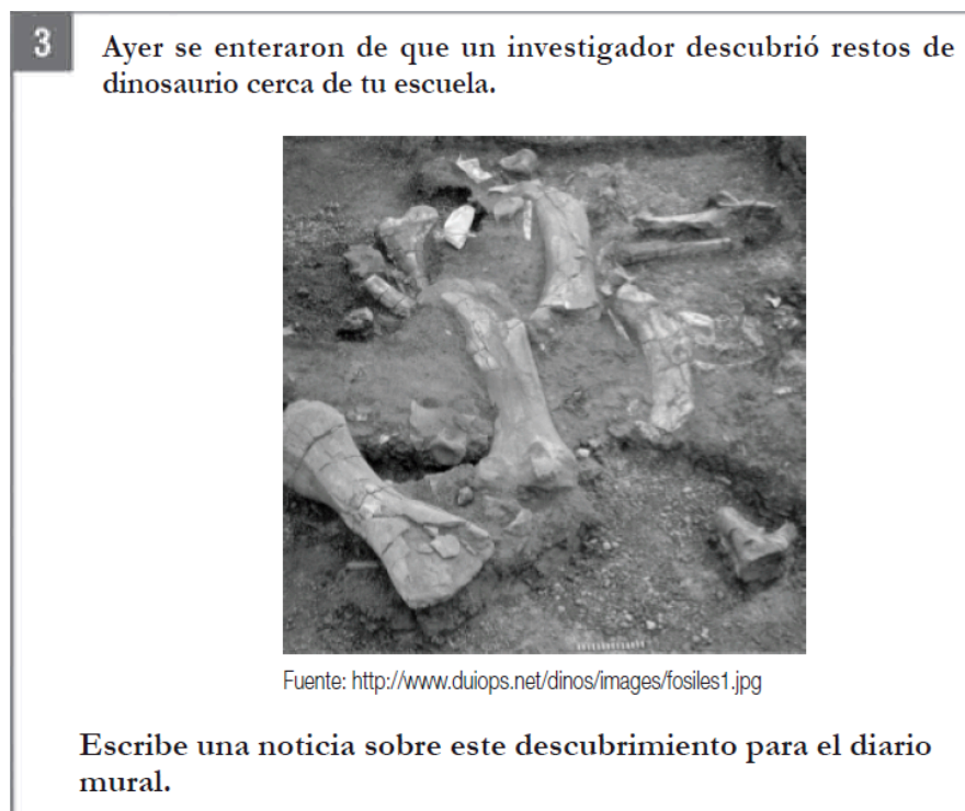
Figura 3. Tarea para escribir una noticia (texto expositivo), prueba SIMCE Escritura 2008 (MINEDUC, 2009)

En la tercera y última tarea, se pidió a los niños escribir una noticia a partir del estímulo: Ayer se enteraron de que un investigador descubrió restos de dinosaurio cerca de tu escuela. Escribe una noticia sobre este descubrimiento para el diario mural (ver figura 3).