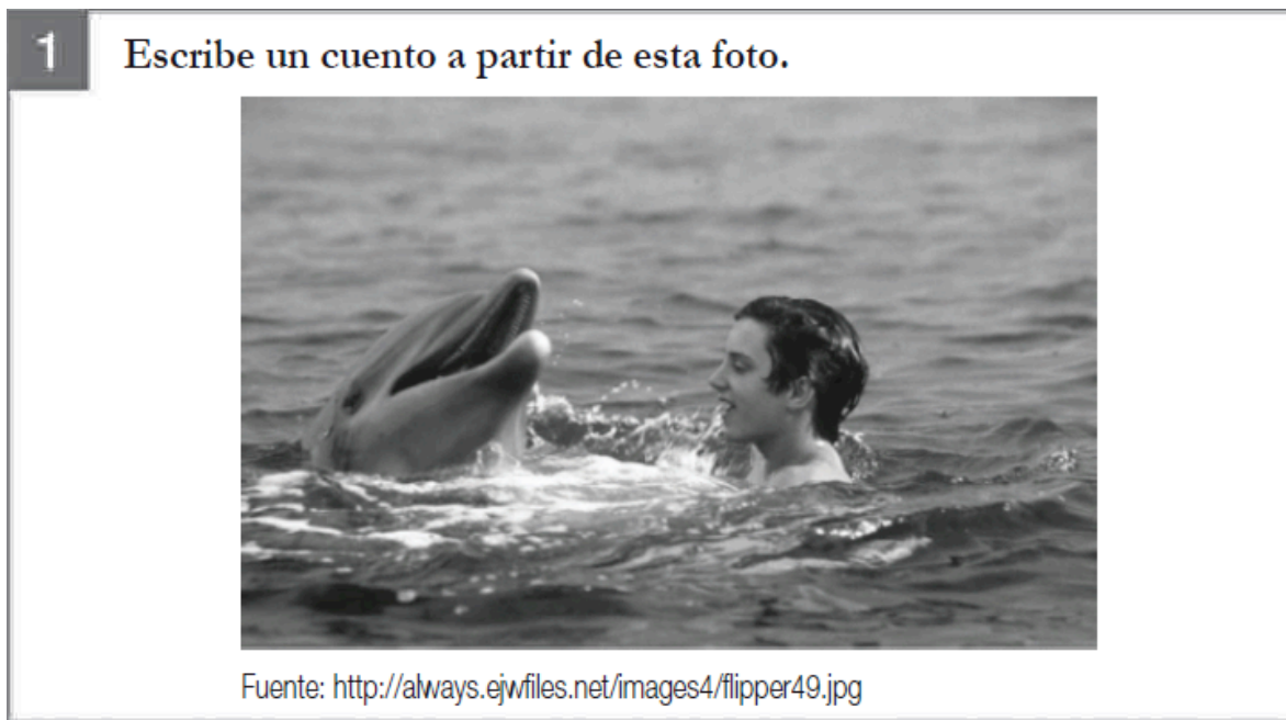
Figura 1. Tarea para escribir un cuento (texto narrativo), prueba SIMCE escritura 2008 (MINEDUC, 2009)

La segunda tarea consistió en la escritura de una carta de solicitud, motivada por la instrucción Tu curso juntó plata para ir de paseo. Te eligieron para convencer al director de la escuela de que les dé permiso para ir. Escribe una carta al director de tu escuela para convencerlo de que les dé permiso para ir de paseo (ver figura 2).